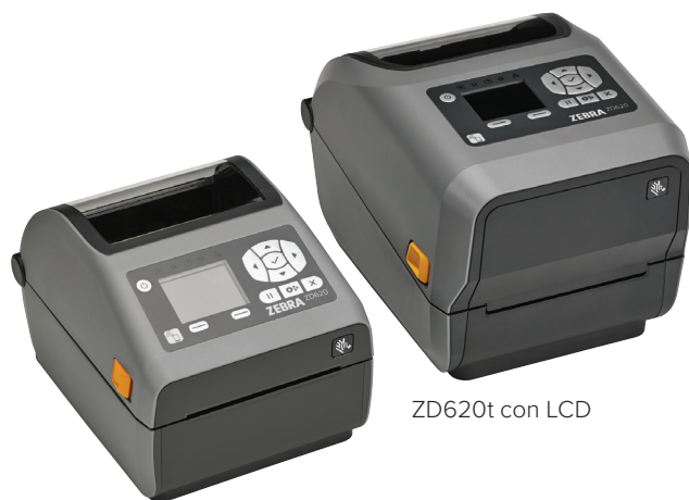
ZD620d con LCD

Cuando la calidad de la impresión, la productividad, la flexibilidad en las aplicaciones y la facilidad de administración son importantes, la ZD620 es la opción. La ZD620 es parte de la nueva generación de impresoras de mesa de Zebra, sustituye las impresoras de la Serie GX y a la ZD500 de Zebra y supera a las impresoras de mesa comunes con una calidad de impresión premium y funciones de punta. La impresora es disponible en los modelos de transferencia térmica directa y térmica, así como modelos específicos para el sector del cuidado de la salud. La ZD620 fue creada para atender a una gran variedad de aplicaciones y proporciona más funciones estándar que cualquier impresora de mesa de Zebra. Con una interfaz opcional de 10 botones con pantalla LCD en color, usted no necesita adivinar la configuración y el estado de la impresora. La ZD620 usa Link-OS® y nuestro poderoso conjunto de aplicaciones, utilitarios y herramientas de desarrollador Print DNA, que ofrece una experiencia de impresión superior con un mejor desempeño, una administración remota simplificada y fácil integración. La ZD620 de Zebra: ofrece la velocidad de impresión, la calidad de impresión y la administración que usted necesita para continuar sus operaciones.